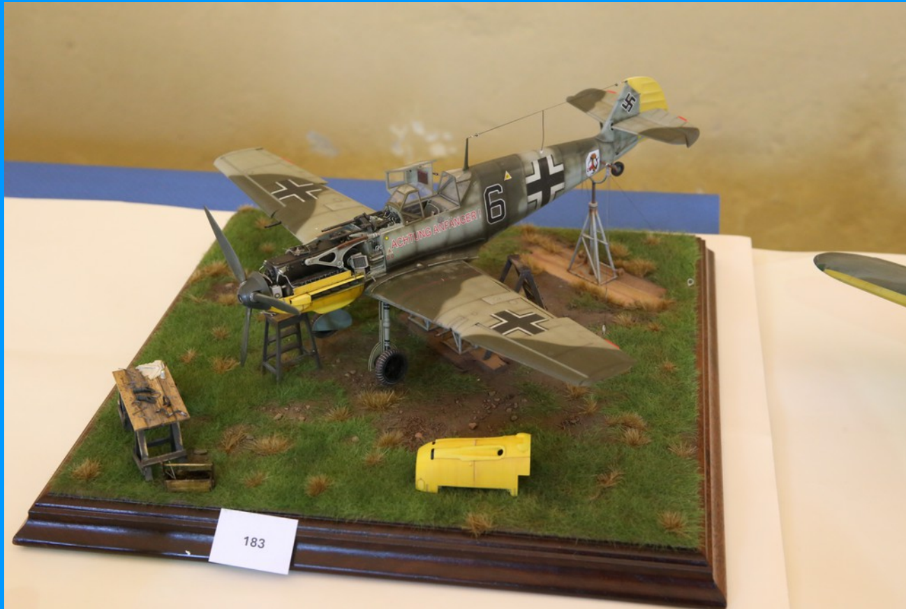
Bf 109 E4