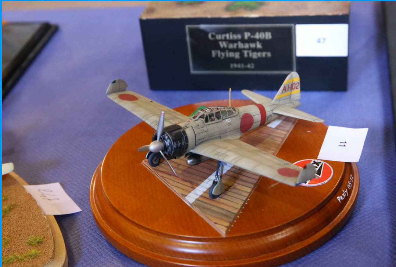
Mitsubishi A6M2 ZEKE