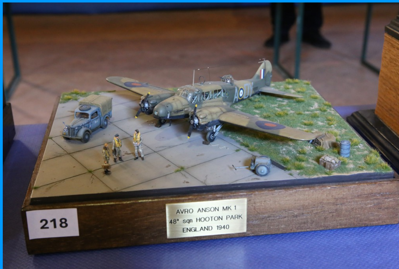
Avro Anson Mk I