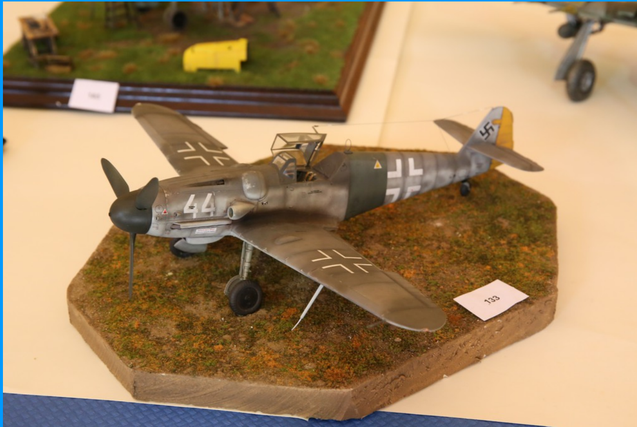
Messerschmitt Bf 109 G-14