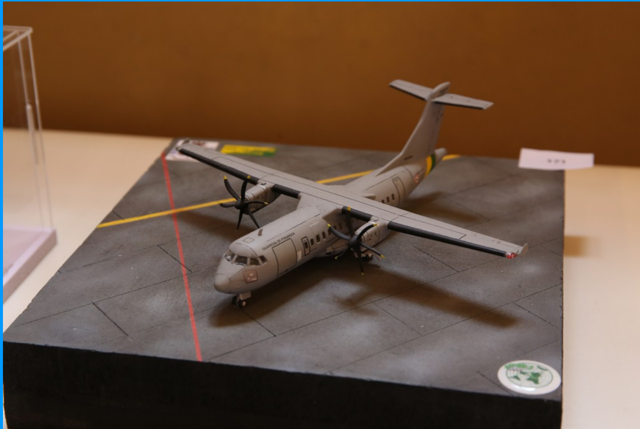
ATR-42 500 MP "Surveyor" GdF