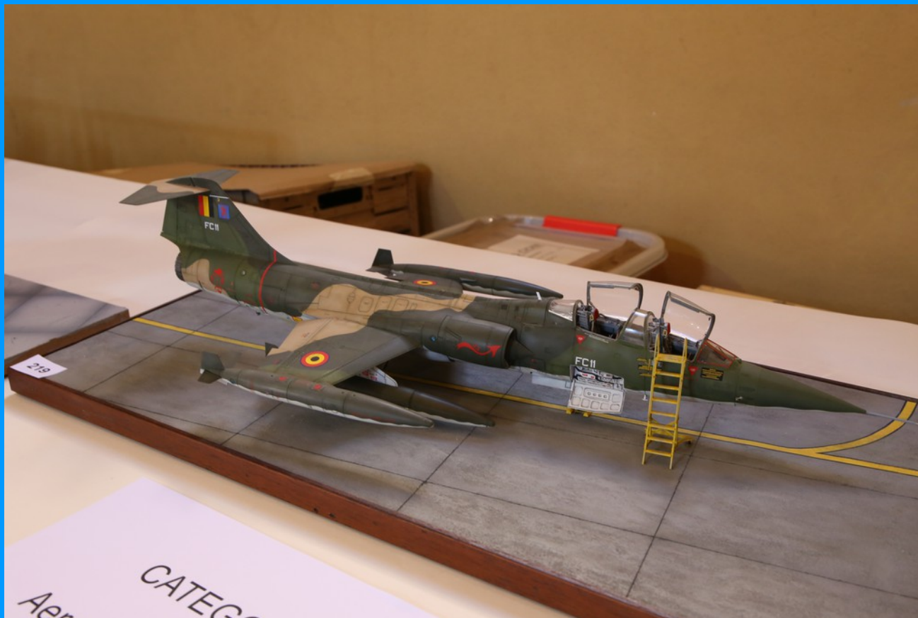
TF 104 G