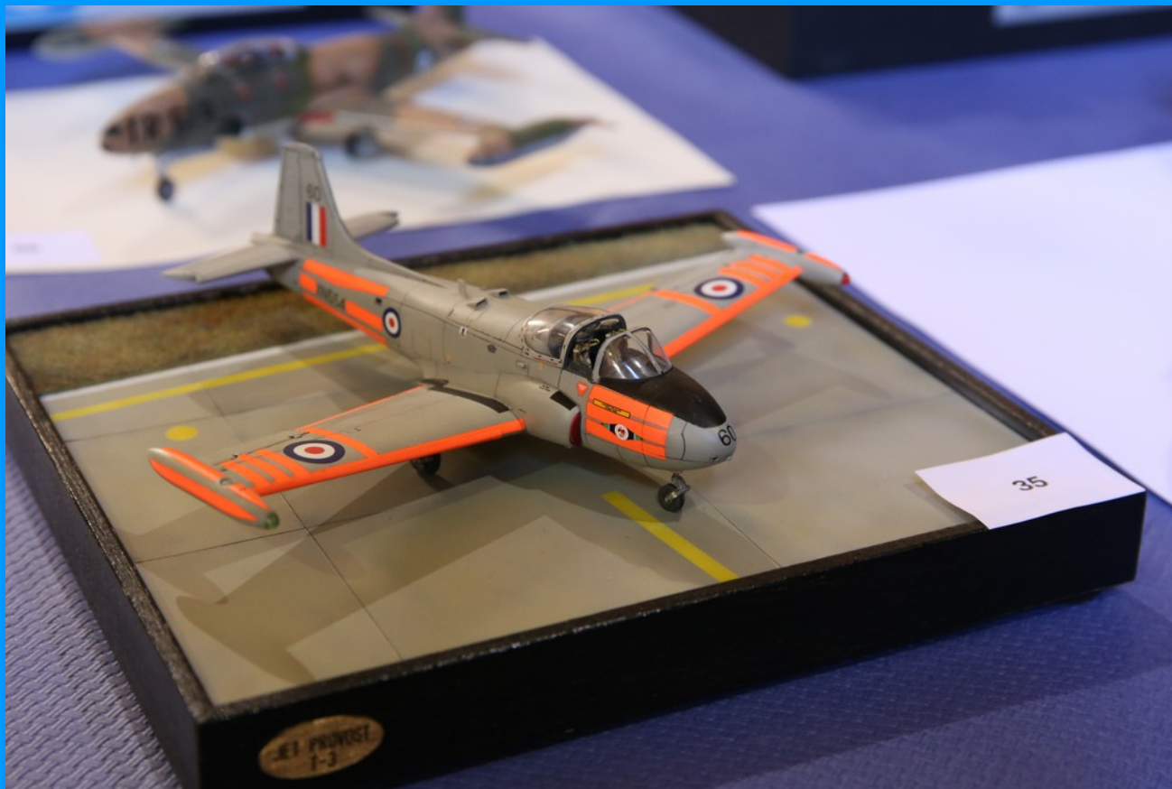
Jet Provost T3