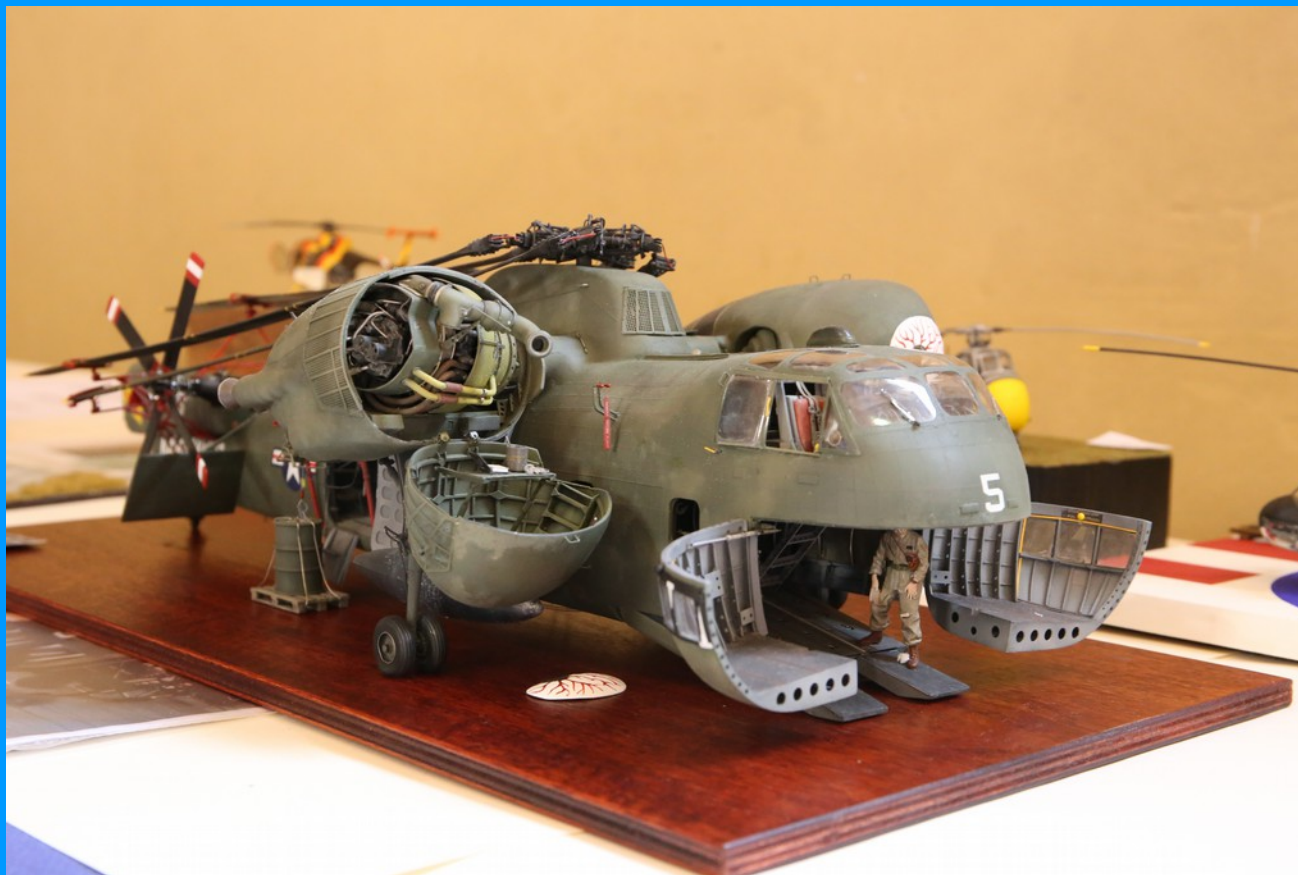
Sikorsky CH-37 Mojave