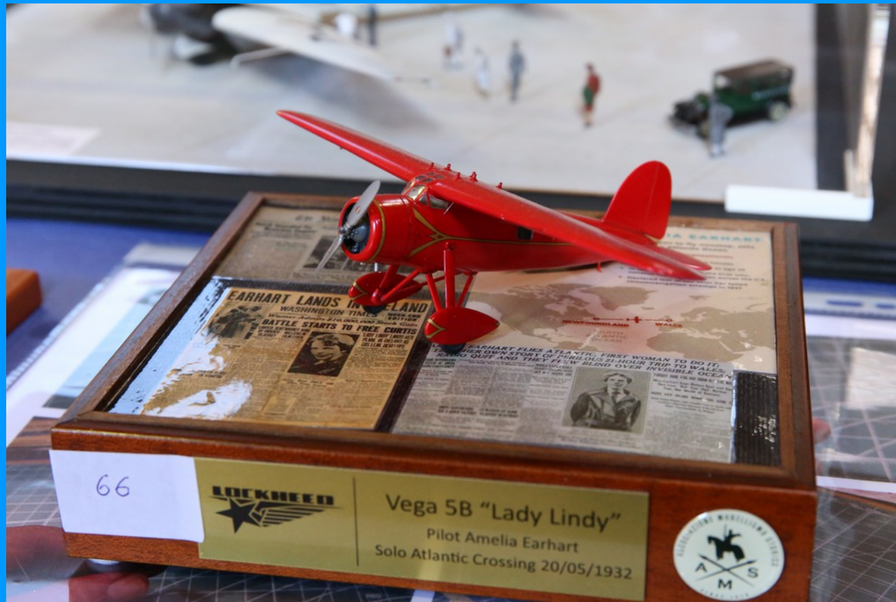
Lockheed Vega 5B "Lady Lindy"