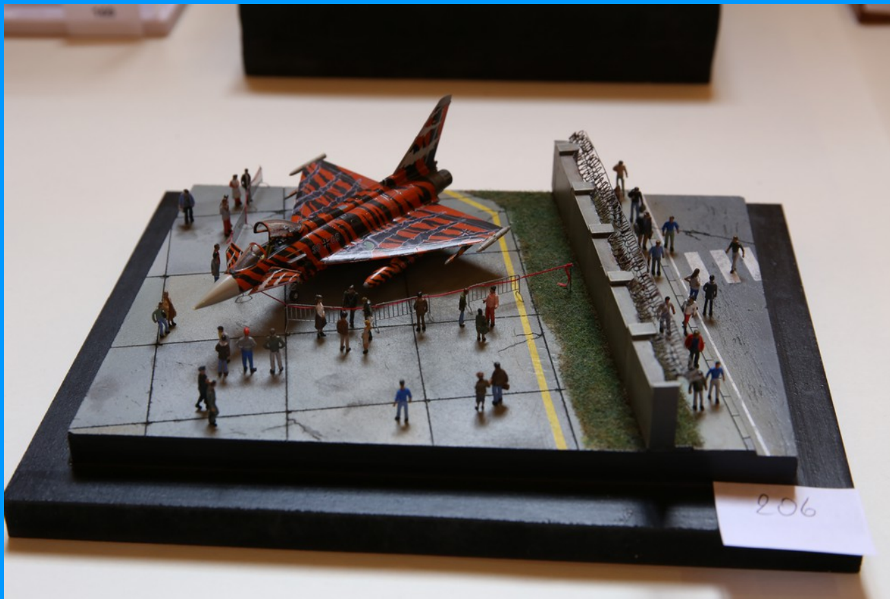
Efa Tiger Bronze