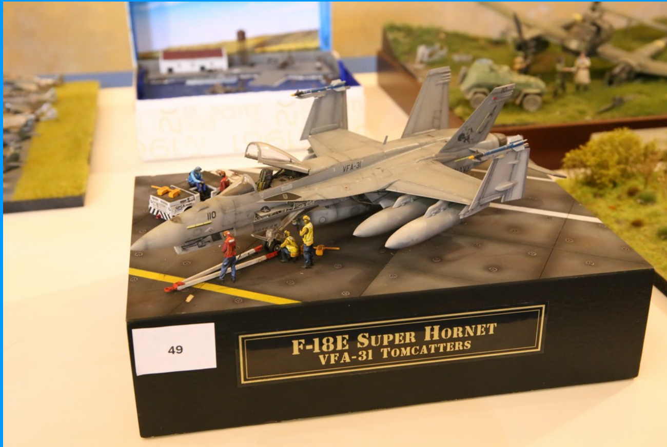
F 18E Super Hornet