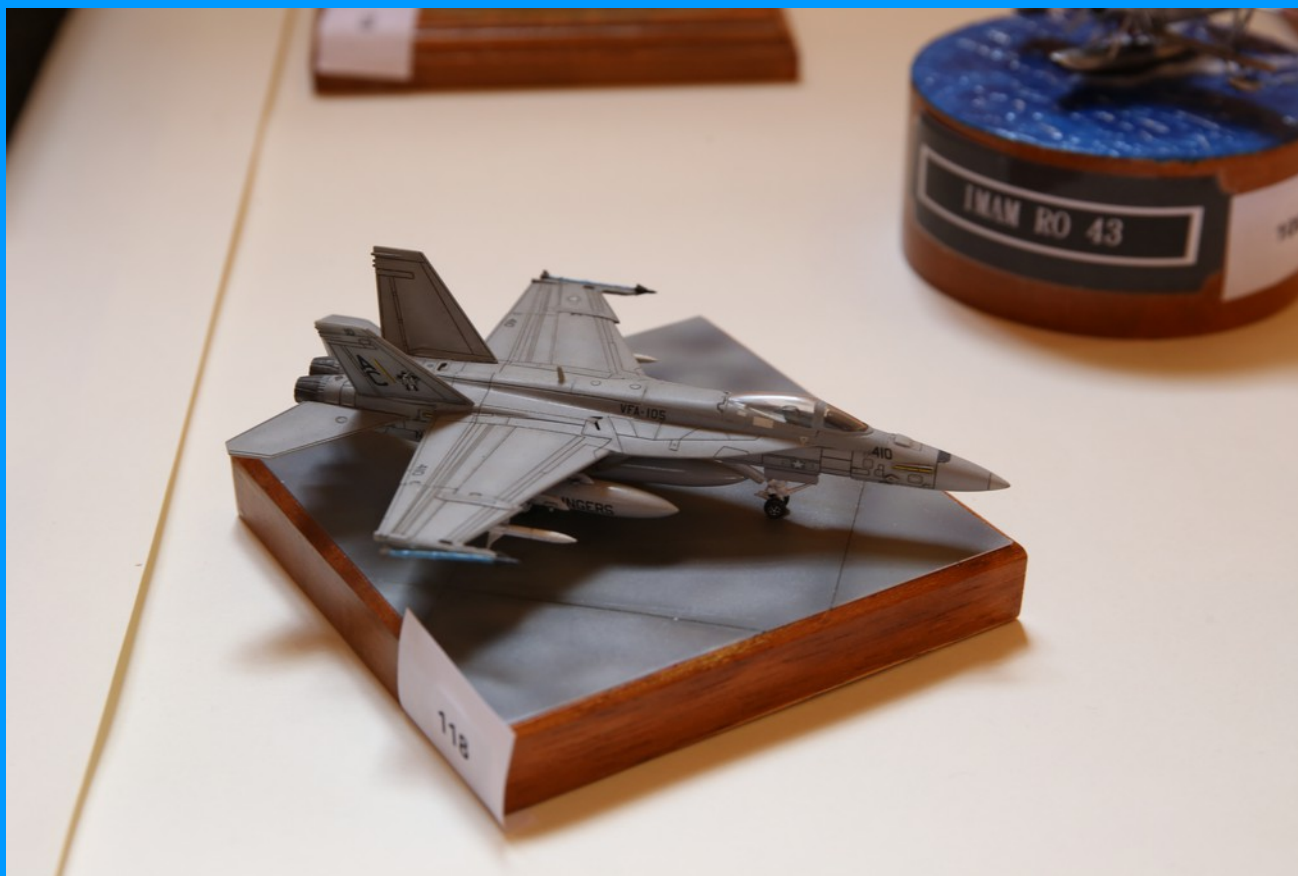
F 18 Hornet