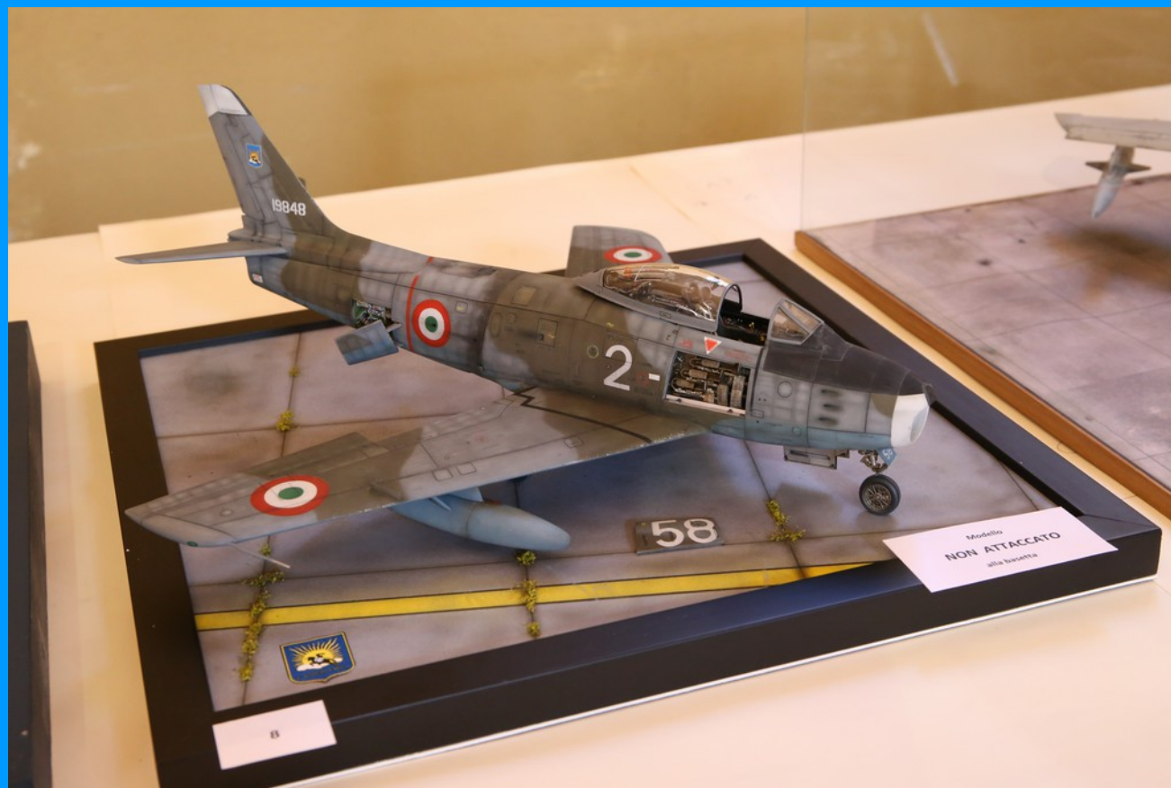
F-86E 2° Stormo AM