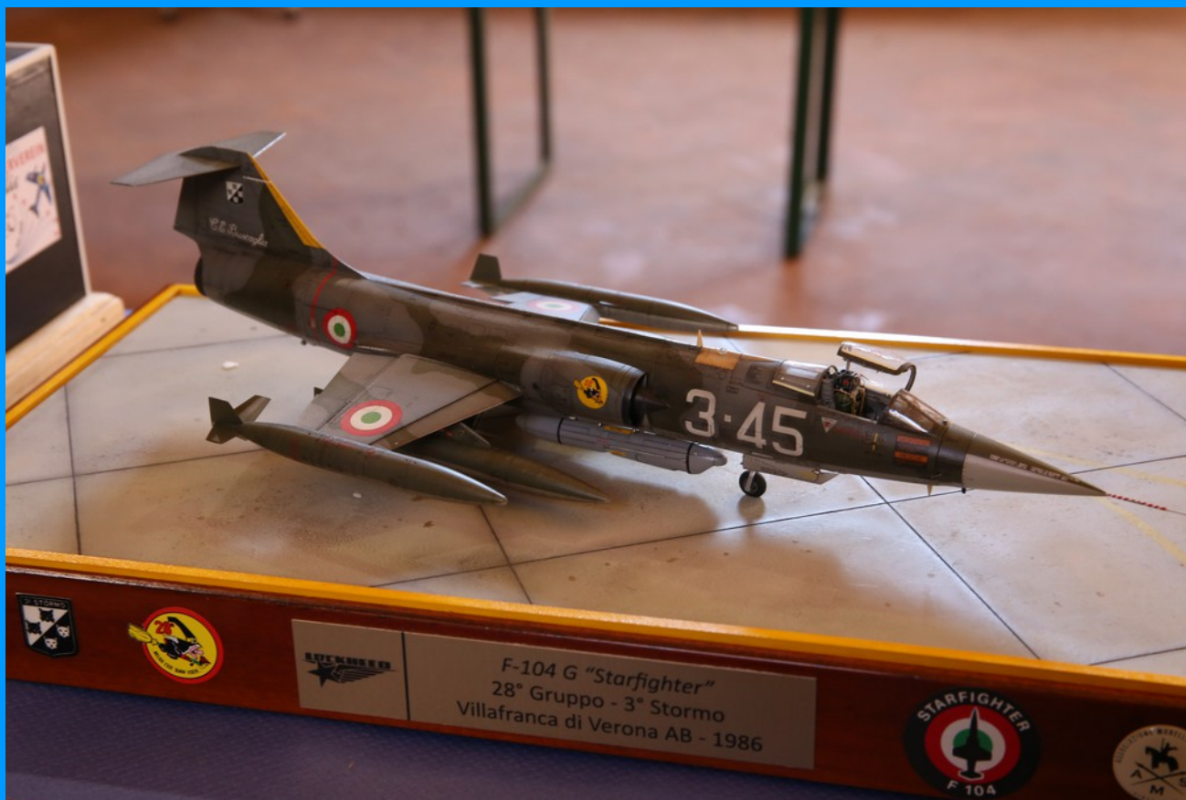
F104 G Starfighter