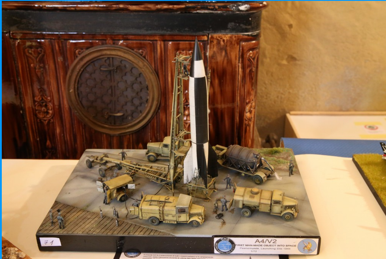
Sito di lancio missile V2