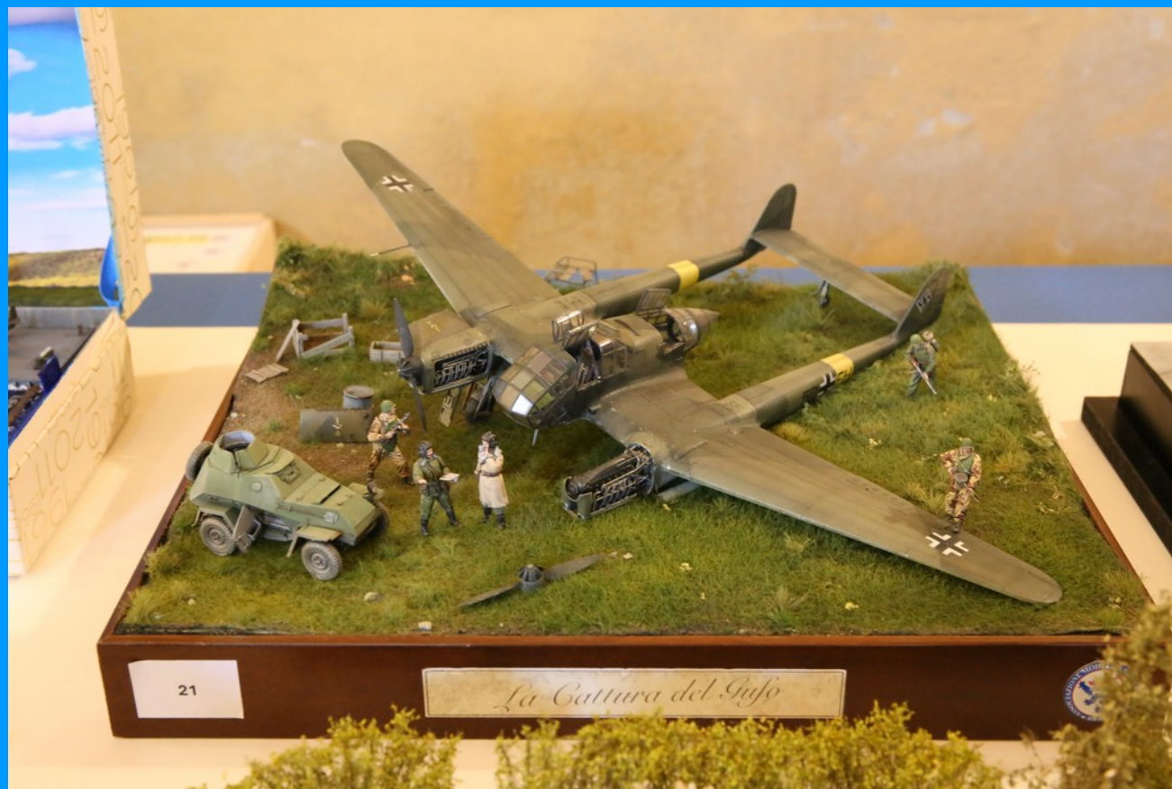
Fw 189 "Cattura del Gufo"