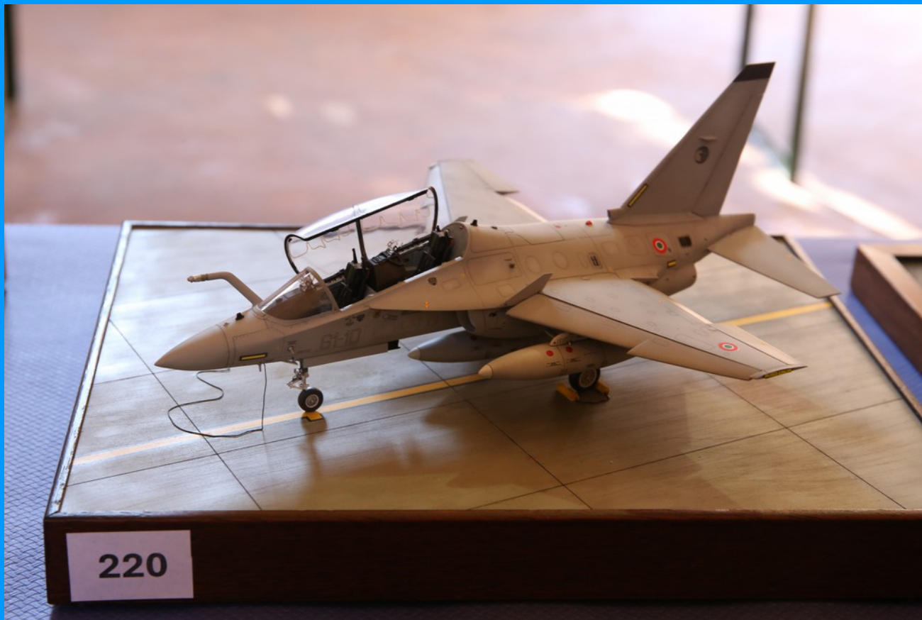
T-346 A Master