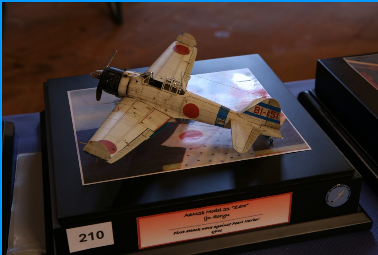
A6M B Zero Soryu