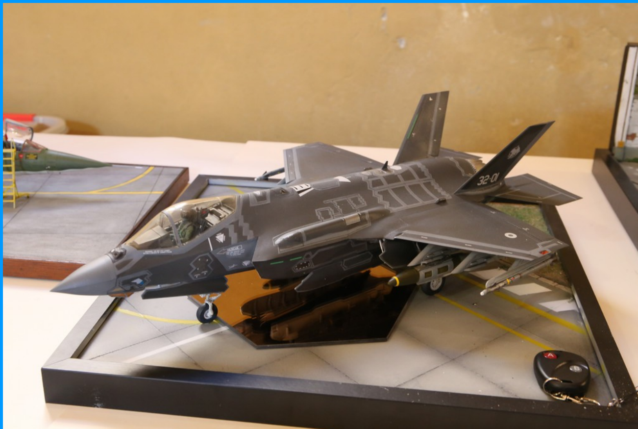
F35A Lightning II