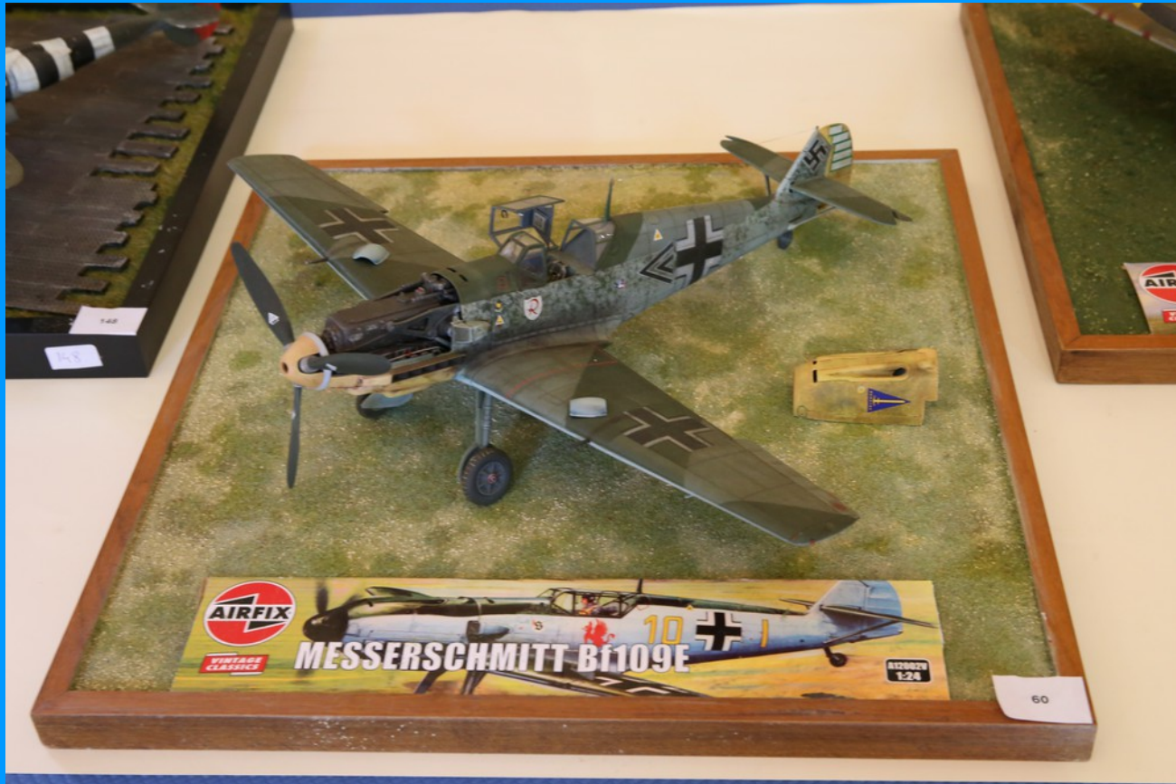
Messerschmitt Bf-109 E4