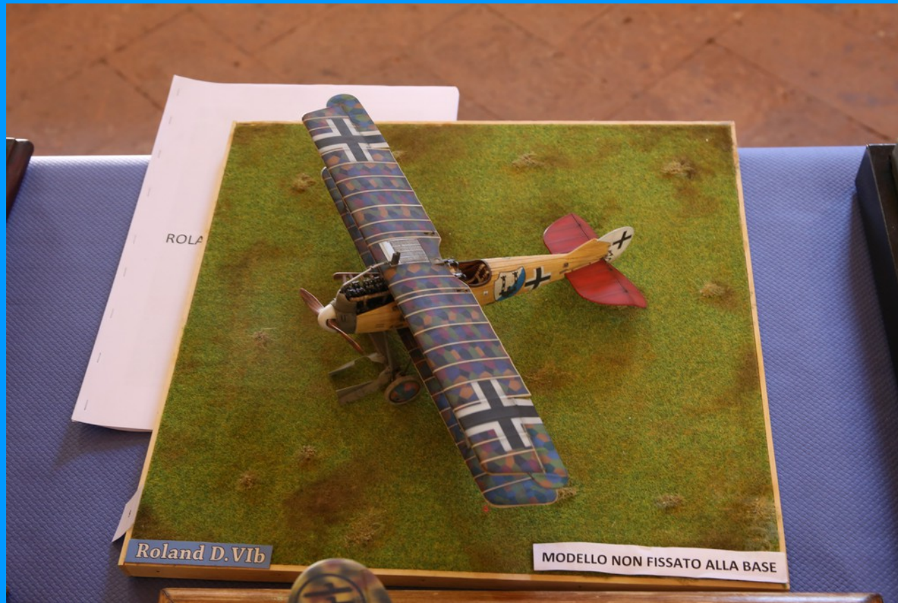
Roland D Vb