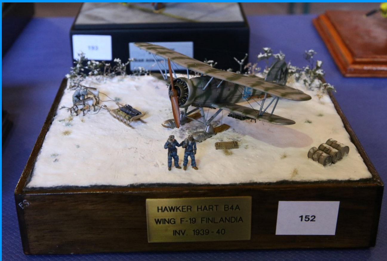
Hawker Hart B4A