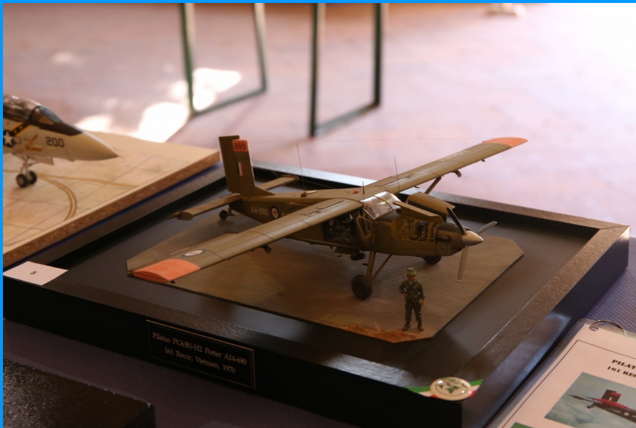
Pilatus PC-6/B1-H2 Porter