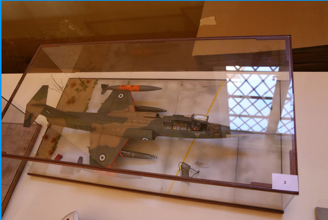
F-104G Hellenic AF