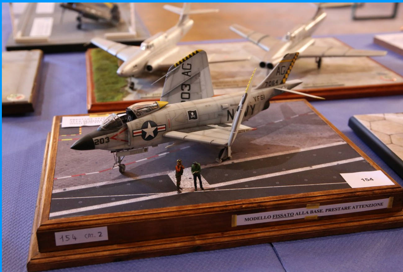
McDonnell F3H-2M Demon