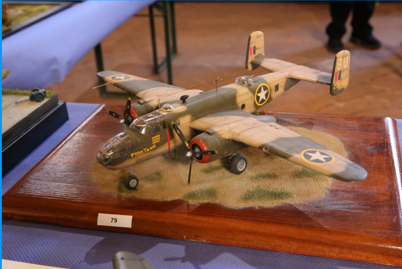
North American B25-C