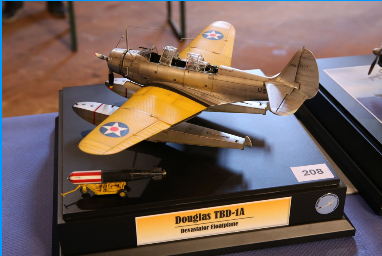
Douglas TBD-1A Devastator