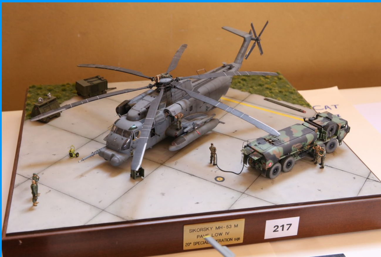
MH-53M "Pave Low"