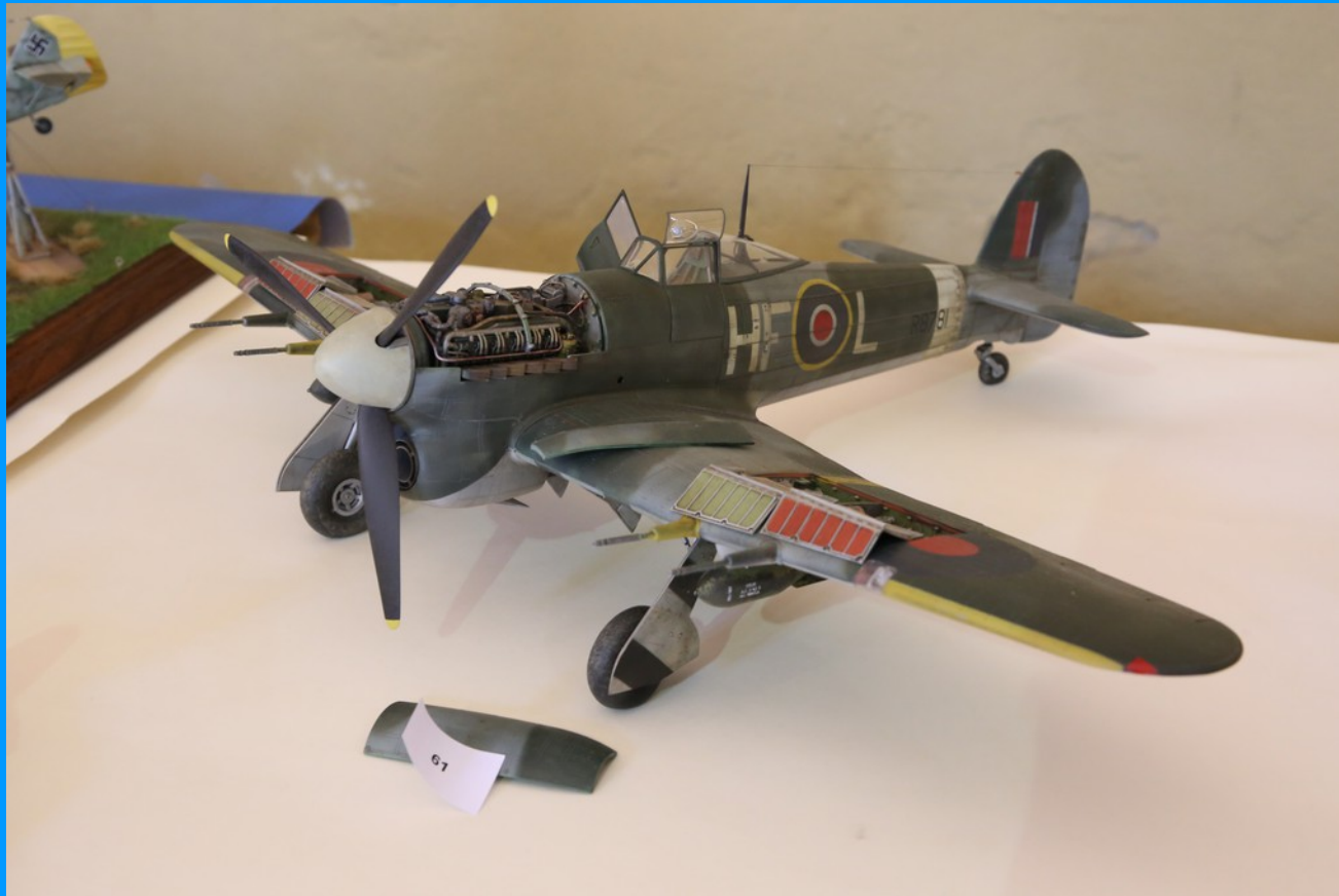
Hawker Typhoon MK. 1B