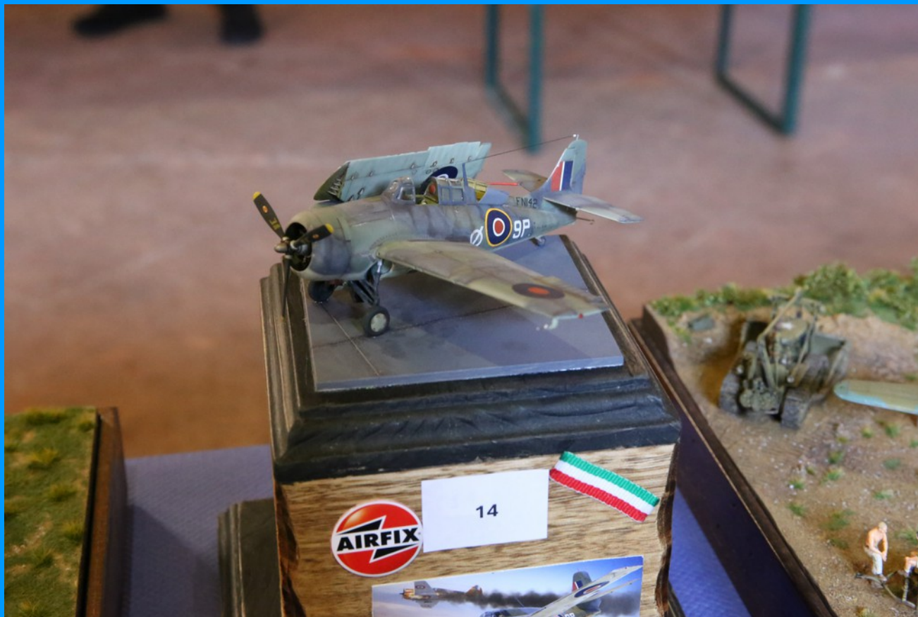
Grumman Martlet MK IV