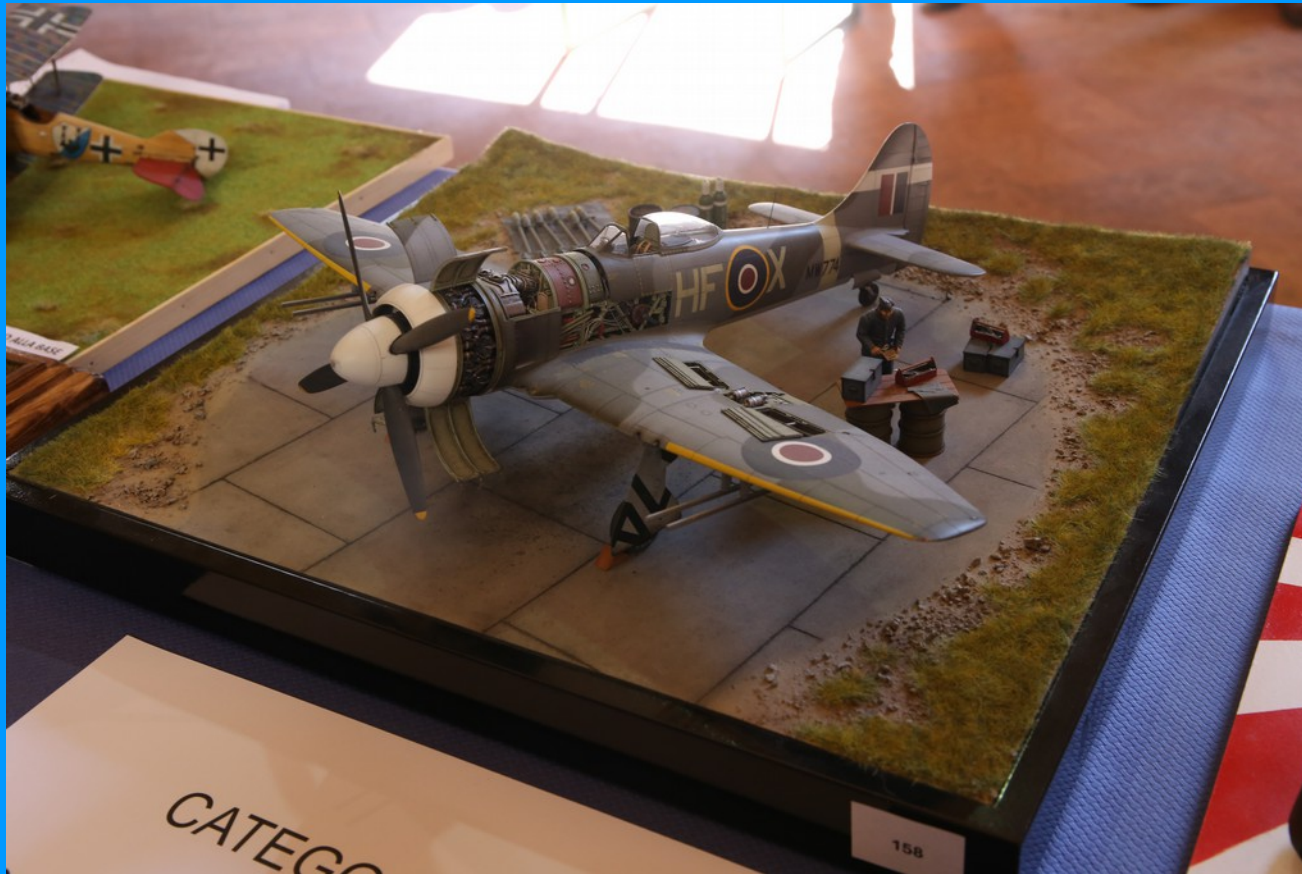
Hawker Tempest Mk.II