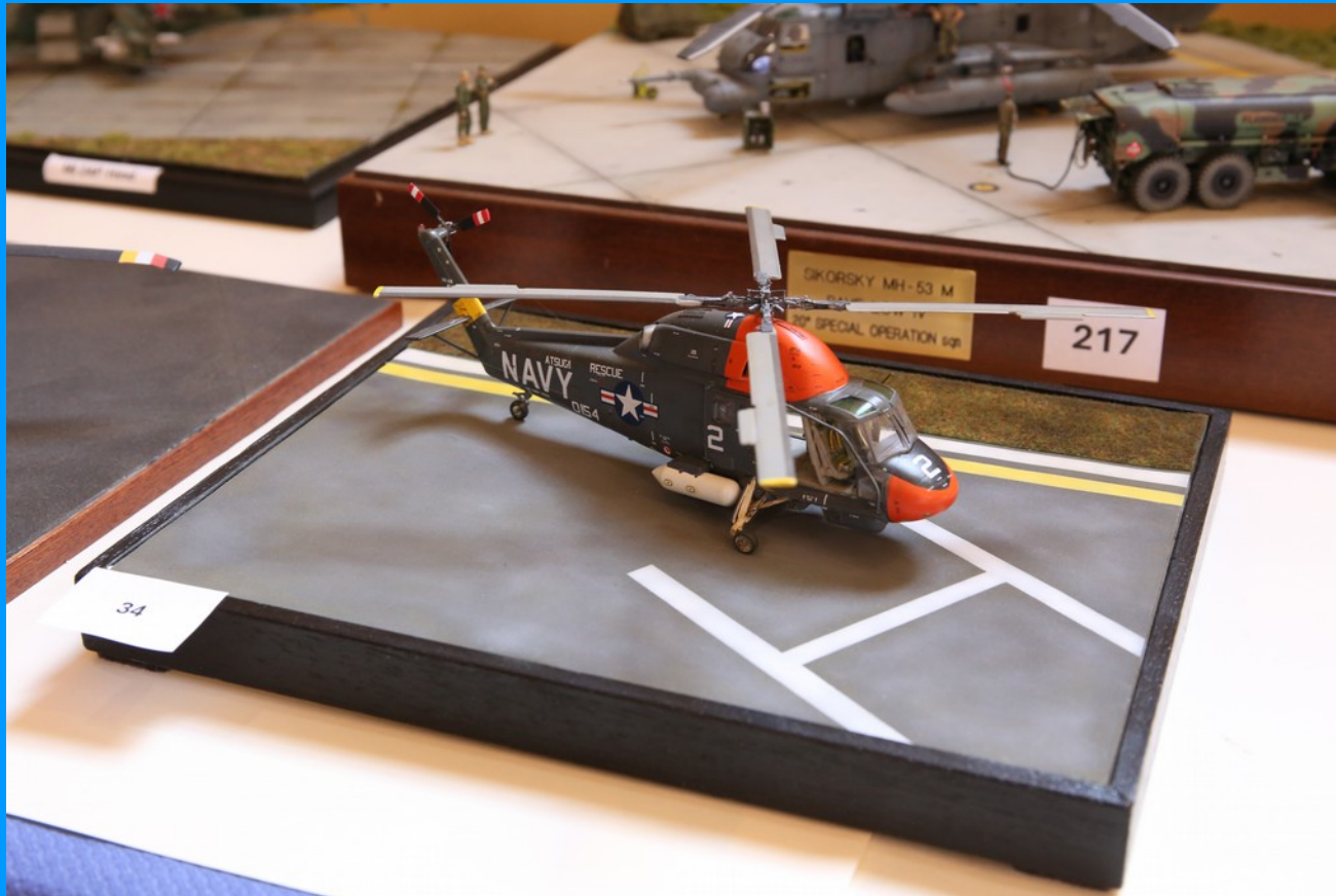
Kaman UH2 A/B